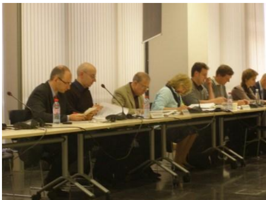
Assemblée générale du 24 juin

L'organisation coupole des conseils de DD en Europe (EEAC) a préparé un « statement » en vue de sa conférence annuelle, qui aura lieu au mois de septembre en Pologne. La conférence ainsi que le statement traitent des deux thèmes principaux de la conférence mondiale Rio+20 qui aura lieu l'année prochaine: « l'économie verte » et « gouvernance du DD ». Le secrétariat du CFDD a participé à la préparation du statement sur base de notre avis récent en la matière (voir http://www.frdo.be/DOC/pub/ad_av/2011/2011a03f.pdf ). Le texte a été approuvé par l'Assemblée générale du 24 juin dernier.