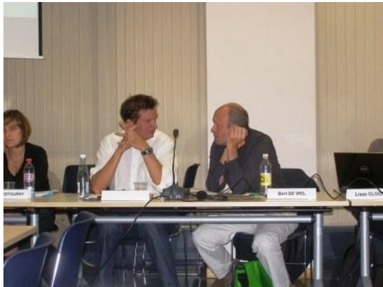
L'assemblée générale du 23 septembre 2011

Cliquez ici pour le texte complet de l'avis: http://www.frdo-cfdd.be/DOC/pub/ad_av/2011/2011a13f.pdf