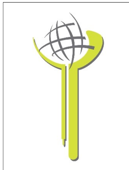
Prix développement durable pour la presse 2011

Tous les trois ans, le CFDD organise une enquête sur l'assise sociale du DD dans notre pays. Cette année-ci, l'enquête portera sur la perception du long terme dans le groupe des jeunes. Dans une première étape, une méta étude sera effectuée, portant sur les enquêtes qui ont déjà été réalisées en Europe et en Belgique sur les jeunes et leur vision du long terme.