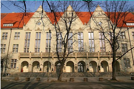
EEAC conference 2011

Vous trouverez tous ces documents, ainsi que les présentations faites lors de cette conférence, sur le nouveau site de l'EEAC : http://www.eeac.eu/annual-conferences/wroclaw-2011 .