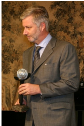
La remise des Prix à la presse écrite, le 27 octobre 2010

Vous trouverez une invitation pour cet événement en annexe . Votre inscription est attendue pour le 17 février au plus tard. De plus amples informations (modes d'accès...) sont disponibles sur notre site web .