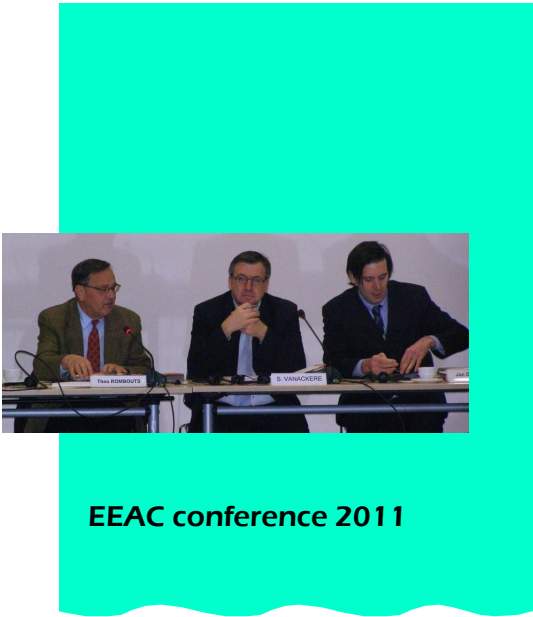
EEAC conference 2011

Le rapport annuel 2011 rappelle aussi les objectifs, la composition et le fonctionnement du Conseil et de ses organes (assemblée générale, bureau, groupes de travail et secrétariat), il contient par ailleurs un rapport financier.