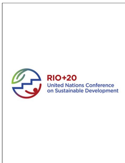
Un avis sur le "zero draft" pour Rio+20 est en préparation