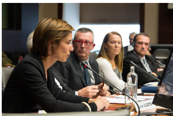
Colloque, 25 septembre 2012