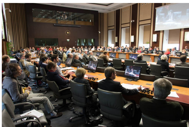
Colloque, 25 septembre 2012