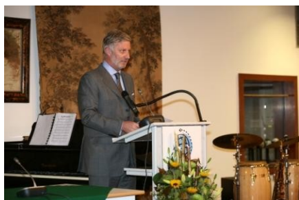
Le Prince Philippe

La remise du Prix par le Prince Philippe aura lieu début 2013.