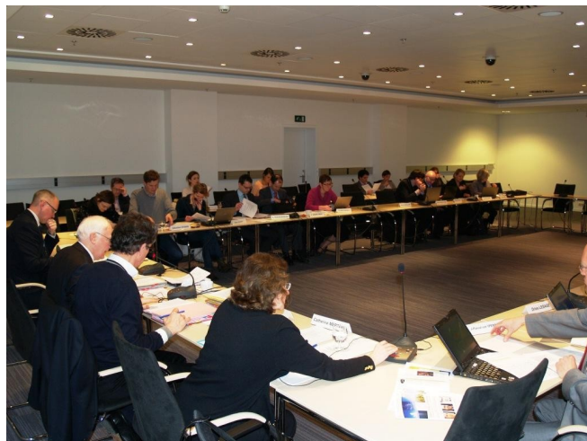
Assemblée Générale | 29 janvier 2013

Elle sera suivie par la remise du Prix développement durable pour la presse.