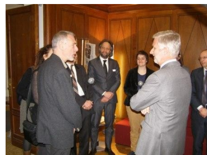
Le Prince Philippe

Vous trouverez de plus amples informations sur le Prix pour la presse sur notre site web .