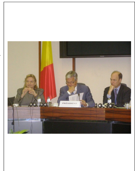
Table Ronde OMC

Une table ronde avec le Ministre Reynders s'est tenue le 14 janvier dernier sur la politique commerciale ainsi que sur les développements au sein de l'Organisation Mondiale du Commerce. Les membres ont donné leur point de vue par rapport au « Doha Development Round » et les accords de commerce bilatéraux de l'UE, et ont discuté avec le Ministre de la position belge et européenne dans ces dossiers.