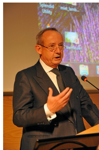
Yvo De Boer

Le mot final revenait à Yvo de Boer, KPMG's Special Global Advisor on Climate Change and Sustainability, ancien Secrétaire exécutif de la Convention cadre des Nations Unies sur les changements climatiques.