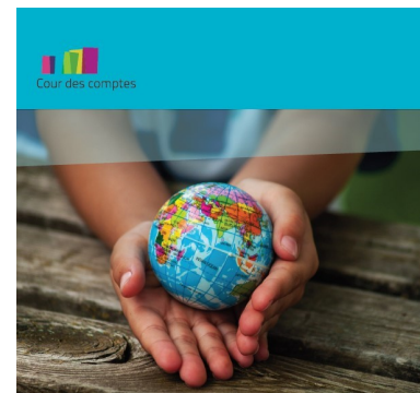
Objectifs de développement durable

Début septembre, le CFDD organisera un séminaire au cours duquel l'audit de la Cour des comptes sera présenté. Plus d'informations sur le site du CFDD.