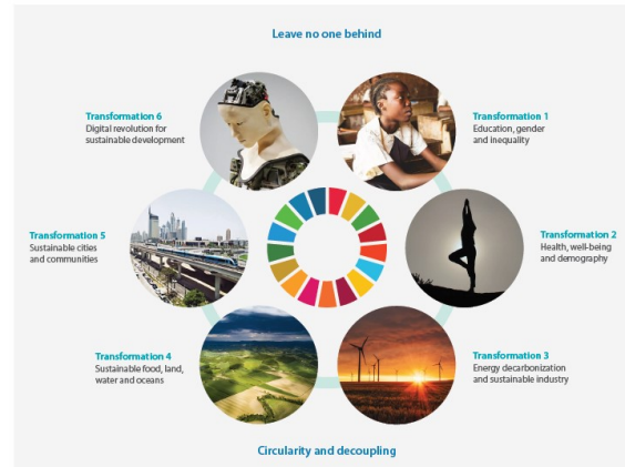
Six SDG Transformations

Le rapport préconise donc de placer les "6 transformations des SDG" au cœur de la politique de relance économique: (1) Éducation, genre et inégalité, (2) Santé et bien-être, (3) Énergie propre et industrie durable, (4) Alimentation, sol, eau et océans, (5) Villes durables, (6) Numérisation.