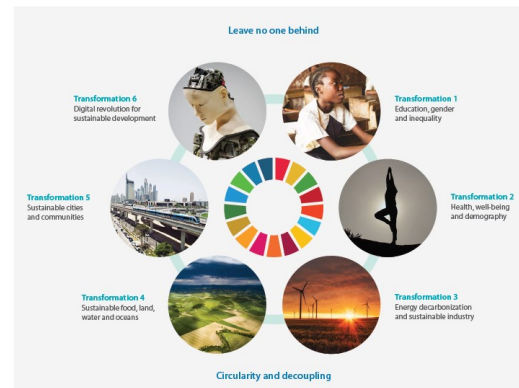
Six SDG Transformations

Het rapport pleit er dan ook voor om '6 SDG-transformaties' centraal te stellen in het economisch herstelbeleid. Het gaat om: (1) Onderwijs, gender en ongelijkheid, (2) Gezondheid en welzijn, (3) Schone energie en duurzame industrie, (4) Voedsel, bodem, water en oceanen, (5) Duurzame steden, (6) Digitalisering.